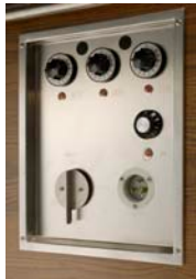
PANNEAU DE CONTRÔLE