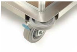
PARE-CHOC ROTATIFS EXCLUSIFS ET FREINS DIRECTIONNELS ACTIONNÉS AU PIED